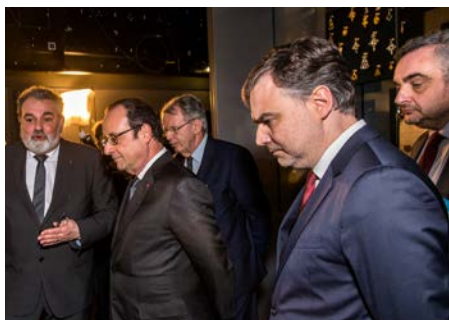
Visite de François HOLLANDE, Président de la République au Musée de la Franc-Maçonnerie le 27 février 2017

Le Grand Orient de France fonctionne sur un modèle démocratique. Ses loges sont souveraines. Les différentes fonctions (Grand Maître, Conseillers de l'Ordre, Présidents des loges...) sont toutes électives et encadrées sur le plan du cumul, du renouvellement et de la durée. Les loges sont représentées à l'Assemblée générale (le Convent) selon le principe « une loge, une voix ».